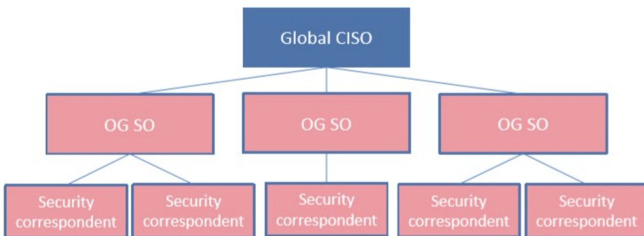
Figure 3 - Organización de la gobernanza de ISS de Bureau Veritas

La gobernanza también incluye cualquier rol relevante para la animación de la Seguridad del Sistema de Información dentro de las actividades de negocios, funciones de control, gestión de proyectos y Dirección.